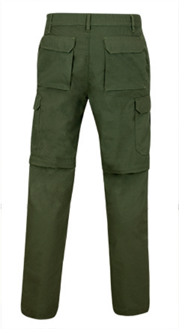
Vista parte trasera de la prenda